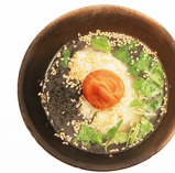
お茶漬け CHAZUKE(Broth base) -しゃけ in salmon -梅 pickled ume