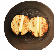
男爵いも DANSYAKU HOKKAIDO-Potatos