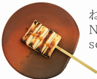
ねぎ NEGI scallion