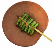
青唐 SHISHI-TOU Small green pepper