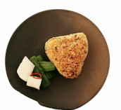
焼きおにぎり YAKI-ONIGIRI grilled rice ball