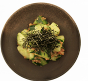
きゅうりの梅肉和え Cucumber&plum pulp