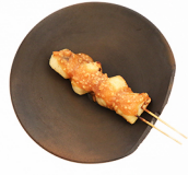
にんにく NINNIKU Garlic