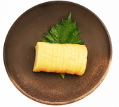
いぶり沢庵 TAKUAN Smoked Radish