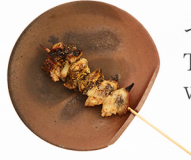
つぶ貝 TSUBU-GAI whelk