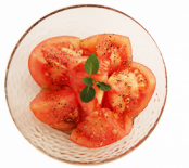
トマトのオリーブオイル和え TOMATO with Olive-Oil rolled in Bacon