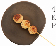
小たまねぎ KO-TAMANEGI Petit Onion