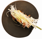
あつあげ ATSU-AGE Fried Tofu