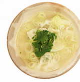
水ぎょうざ SUI-GYOUZA boiled dumpling in soup