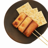
スモークチーズ Smoke Cheese