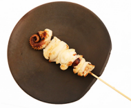
イカゲソ IKAGESO cuttlefish