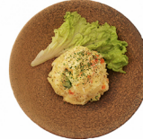
自家製ポテトサラダ Homemade Poteto SALAD