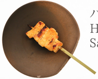
ハラス HARASU Salmon